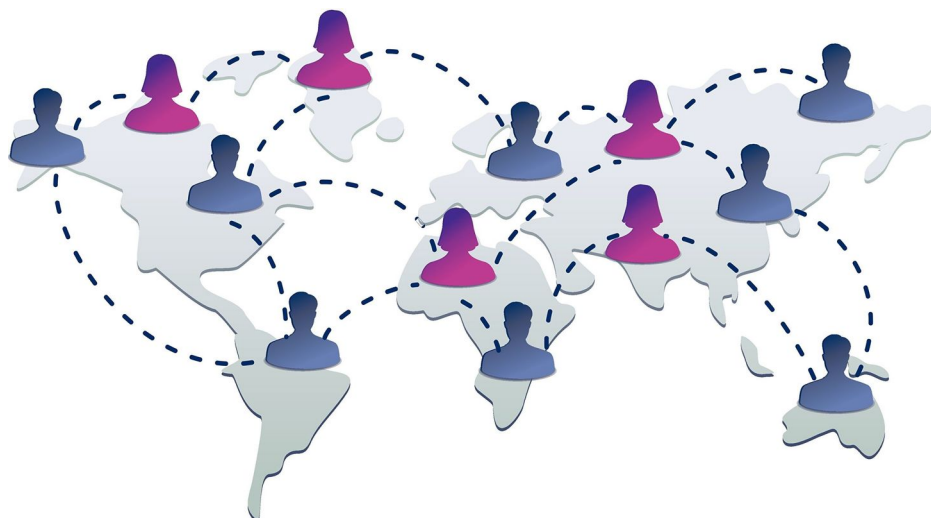
Das Fanpages-Urteil des Europäischen Gerichtshofs hat für Aufsehen gesorgt und hat weitreichende Folgen

Auch das hat dann etwas mit Datenschutz zu tun. Aber es geht dabei nicht darum, etwas zu verbieten. Vielmehr sollen Haftungsrisiken für das Unternehmen vermieden werden. Bitte wirken Sie daran mit, indem Sie die Fragen sorgfältig beantworten.